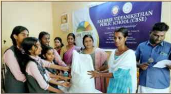
ഹരിശ്രീ വിദ്യാനികേതന്റെ നേതൃത്വത്തിൽ കടലോര മേഖലയിൽ ഓണക്കിറ്റ് വിതരണം