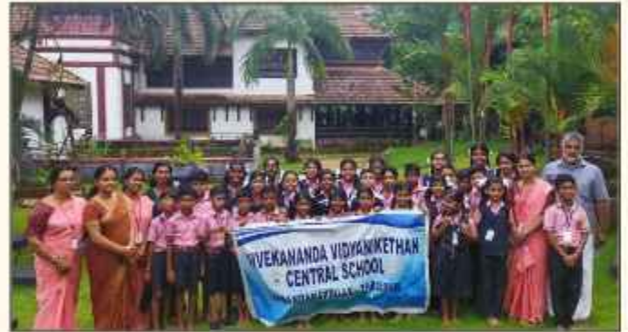
പഠനയാത്രയുടെ ഭാഗമായി വിദ്യാഭാജി വിദ്യാനിക്ഷേതനിലെ വിദ്യാർത്ഥികൾ തൈക്കാട്ടുല്ലേരി ആയുർവ്വേദ മ്യൂസിയം സന്ദർശിക്കുന്നു.