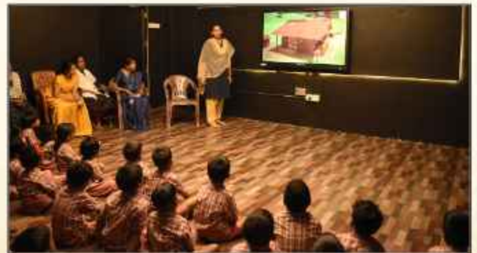
സരസ്വതി വിദ്യാനിക്ഷേതനിലെ കെ. ജി. വിദ്യാർത്ഥികളുടെ ഒരു ദിവസത്തെ സഹവാസ ശിബിരം