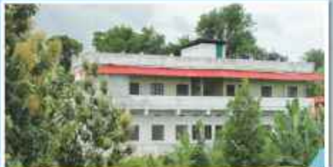
പാലക്കാട് വിദ്യാലയം പാലക്കാട്