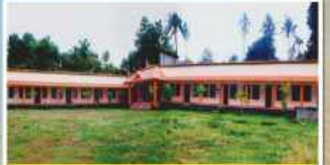
വേലൂർ വിദ്യാലയം പാലക്കാട്, പാലക്കാട്