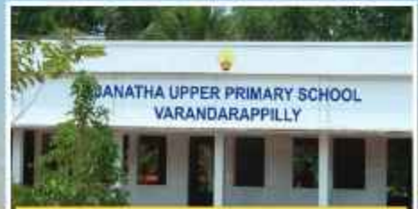
സെന്റ്. ജോർജ്ജ്, വേലൂർ