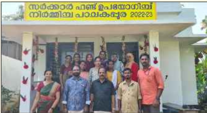
ജനത യൂപി സ്കൂളിൽ പുതിയതായി നിർമ്മിച്ച അടുക്കള