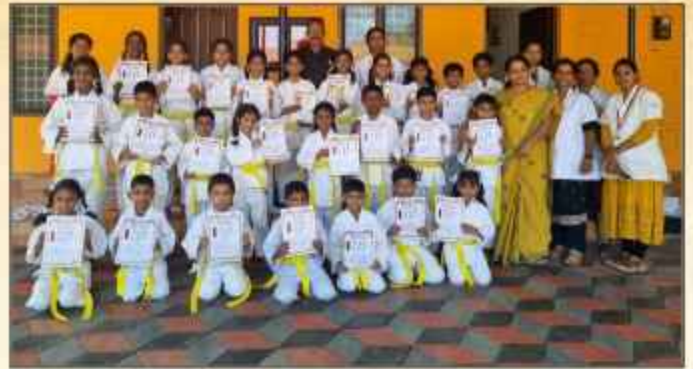
വിവേകാനന്ദ വിദ്യാലയത്തിൽ നടത്തിവരുന്ന കരാട്ടെ ക്ലാസിലെ യെല്ലോ ബെൽറ്റ് നേടിയ വിദ്യാർത്ഥികൾ