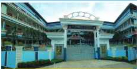
ശിവാകൃഷ്ണൻ വിദ്യാലയം പാലക്കാട്, നാലിക്കര