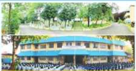
വേലൂർ വിദ്യാലയം അതിർത്തിപ്പാലം