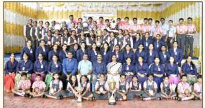
ബിവിഎൻ ജില്ലാ ഭാസ്കരമേളയിൽ റാവറോൾ കിരീടം നേടിയ സരസ്വതി വിദ്യാനിക്ഷേതൻ ടീം