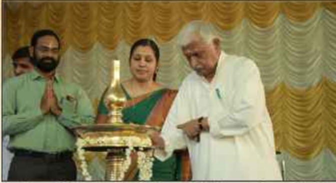
ദ്രസ്റ്റ് സംഘടിപ്പിച്ച അധ്യാപക പരിശീലനത്തിന്റെ ഉദ്ഘാടനം വിദ്യാഭാജി അഖില ഭാരതീയ കാർഷികാരി സഞ്ചൽ ഉന്നയ കാരിപതിച്ചി നിർവ്വഹിക്കുന്നു.