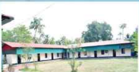
വേലൂർ വിദ്യാലയം അതിർത്തിപ്പാലം, വേലൂർ