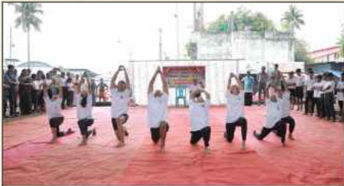
സരസ്വതി വിദ്യാനികേതൻ അന്താരാഷ്ട്രയോഗാ ദിനത്തിൽ കൊടകര ട്രൗണിൽ നടത്തിയ യോഗാപ്രദർശനം